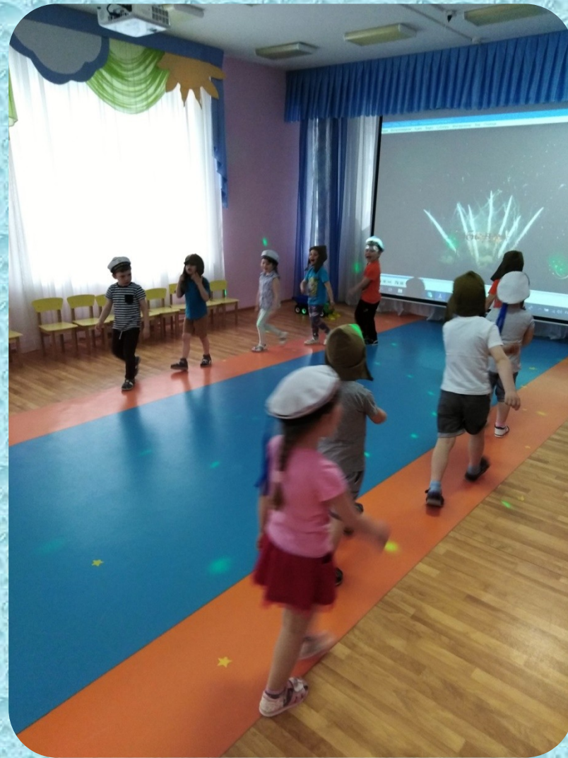
На музыкальных занятиях