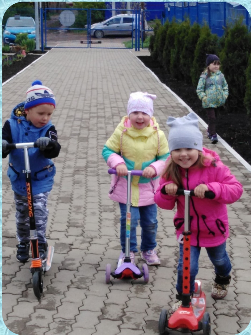
Подвижные игры на прогулке